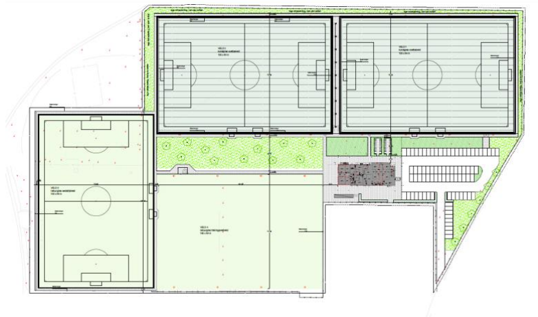
Tekening: Voorlopig ontwerp Sportpark Heugem